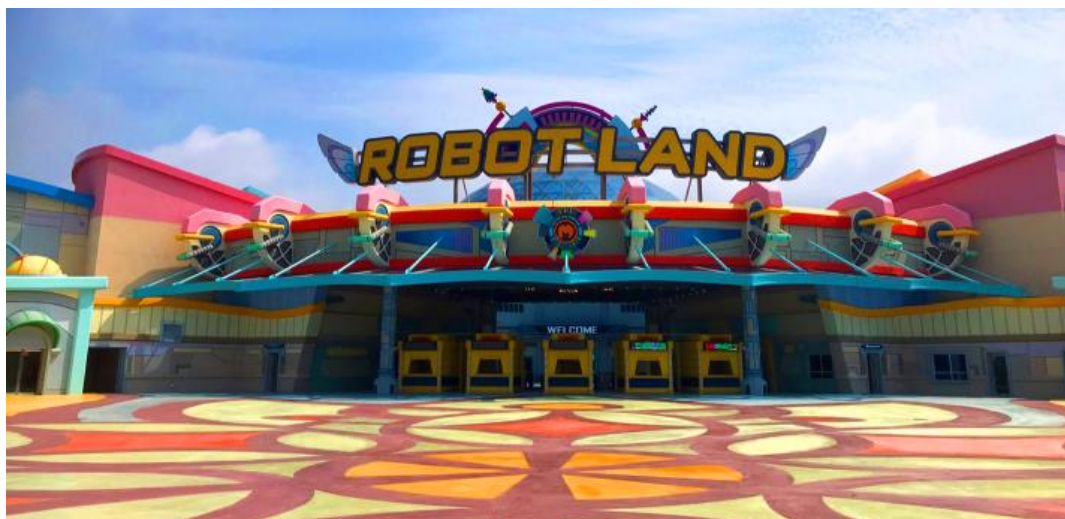
Вход в Gyeongnam Masan Robot Land

Сеул (15 января, 2020) – Christie® с радостью сообщает о том, что в Gyeongnam Masan Robot Land, первом в мире парке аттракционов, посвященном искусственному интеллекту и робототехнике, установлен целый ряд лазерных проекторов и решений для обработки и управления видео Christie. Эти решения помогают создавать потрясающие изображения и удивлять посетителей парка.