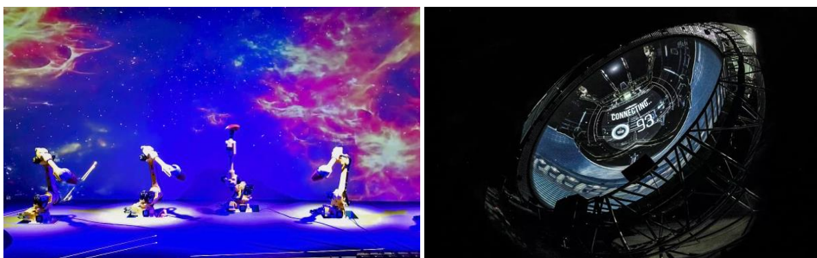
Слева: танцующие роботы-манипуляторы на фоне изображения, создаваемого лазерными проекторами Christie DWU850-GS

Проекторы D13WU-HS создают панорамное изображение на куполе аттракциона виртуальных полетов. В этом аттракционе под названием «Крыло космоса» (Wing of Cosmos), дающем невероятно правдоподобное ощущение полета, на купол высотой 20 метров проецируется контент в 4K разрешении, полностью разработанный D.L.T Group. Кроме того, в шоу используется аудиосистема объемного звучания и подвижные сиденья. Вот почему «Крыло космоса» уже стало самым популярным аттракционом в парке.