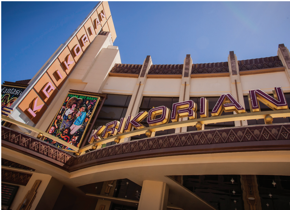
▲ Krikorian Premiere Theatres installiert Christie Vive Audio-System in einem seiner Metroplex 18-Säle in Buena Park.