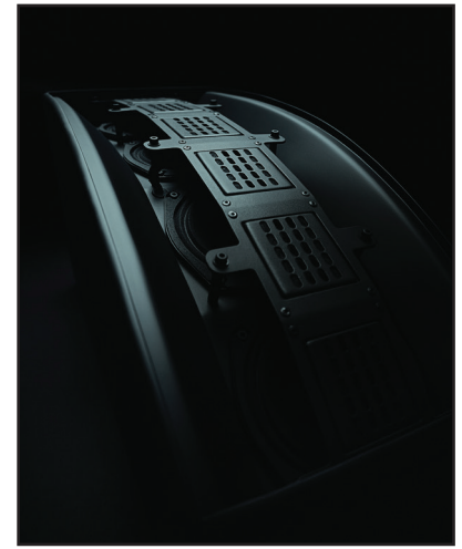
▲ Der Surround-Lautsprecher LA3S kombiniert Bändchen-Treiber-Technologie mit einzigartigem Parabol-Line Array-Design.

Mit zahlreichen Mittel- und Surroundlautsprechern, Subwoofern und Klasse-D-Verstärkern sowie einem Audio-/Videoprozessor ist Christie Vive Audio ein komplettes System. Im Kern von Christie Vive Audio steckt eine Kombination aus Christie-Bändchen-Treibertechnologie sowie Line Array-Lautsprecherdesign. Die Kombination sorgt für überlegene Audioleistung im Vergleich zu traditionellen Punktquellen-Lautsprechern mit Horntriebern, die üblicherweise in Kinos zum Einsatz kommen. Somit wird es zur idealen Plattform für immersive Kino-Audioformate wie Dolby Atmos.