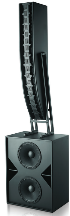
▲ Im Verbund mit dem Subwoofer Christie S215 ergibt der Lautsprecher Christie LA3 ein dreiseitiges, doppelt verstärktes komplettes System.

Nehmen Sie noch heute Kontakt mit uns auf, um mehr darüber zu erfahren, wie auch Ihr Unternehmen von Christie-Systemen profitieren kann.